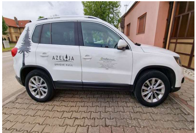
4. Volkswagen Tiguan – motor