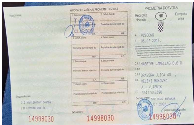
5. Volkswagen Tiguan – prometna dozvola