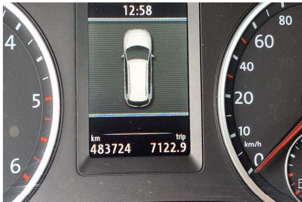
1. Volkswagen Tiguan - km sat