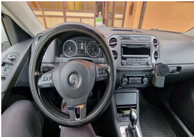
3. Volkswagen Tiguan – unutrašnjost kabine